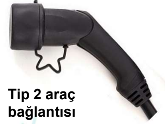
Tip 2 araç bağlantısı