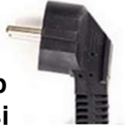
Schuko tip elektrik fişi